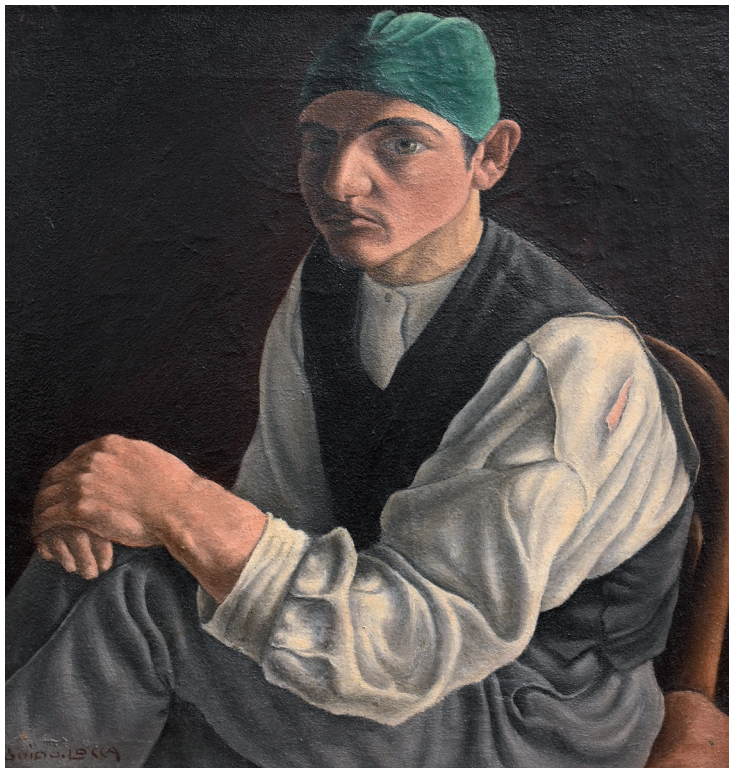
Guido Locca, Auto-portrait , 1918