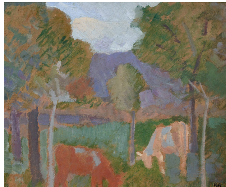
René Victor Auberjonois, Vaches et arbres

Cette petite sélection de peintures d'artistes suisses, datant du milieu du XIX e siècle jusqu'à la troisième partie du XX e siècle, est née de l'admiration et de la gratitude non seulement pour la manière dont ces artistes singuliers ont "regardé" leur monde avec amour, mais aussi pour l'habileté remarquable avec laquelle ils ont transmis leurs "regards" sur la toile. Bien que ces peintres aient été influencés par les développements artistiques et les bouleversements politiques de leur époque, leurs peintures semblent profondément enracinées dans la certitude que la recherche de la "beauté" est toujours légitime et significative. La concentration avec laquelle ils ont peint ce qu'ils "voyaient" semble refléter un profond attachement à cette idée et à leur détermination de la rendre visible. L'espoir est que, si les regards des visiteurs et des peintres se rencontrent, les visiteurs puissent s'approprier, ne serait-ce que l'espace d'un instant, quelque chose des "regards" uniques des peintres.